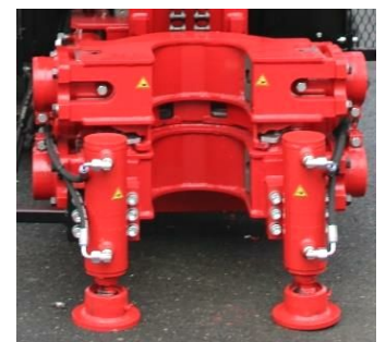
Frein de tige double avec vérins de dé tubage

La sondeuse Pro700 est munie d'arrêts d'urgence sur le panneau de contrôle et sur la télécommande. Elle peut être équipée d'une cage de protection.