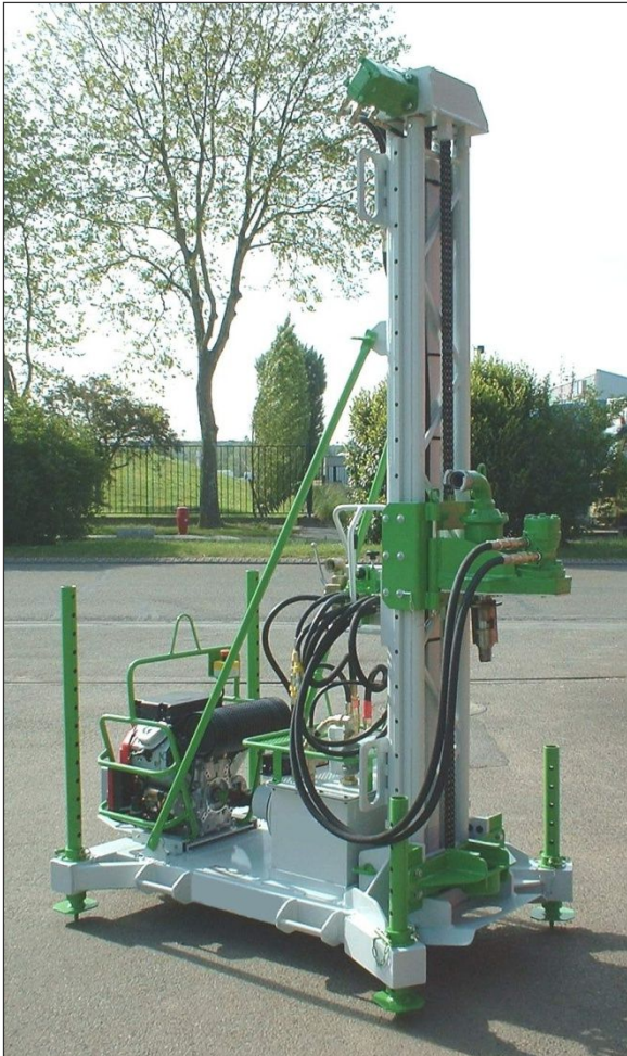
Sondeuse géotechnique EXPLO

L'EXPLO est une sondeuse légère portable, dédiée à l'exploration sismique ou la géotechnique à faible profondeur, pour forage rotatif, carottage, tarière ou marteau fond de trou.